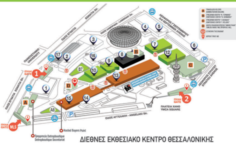
ΔΙΕΘΝΕΣ ΕΚΘΕΣΙΑΚΟ ΚΕΝΤΡΟ ΘΕΣΣΑΛΟΝΙΚΗΣ